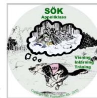
DVD appellklass SÖK

Några filmscener återstår när det blir barmark ... Sedan är det tänkt att filmerna ska följa med böckerna SPÅRHUNDEN och SÖKHUNDEN och användas vid appellklasskurserna. Filmerna kommer självklart även att levereras i kuvert för inklistring i de böcker man redan köpt.