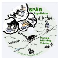
DVD appellklass SPÅR