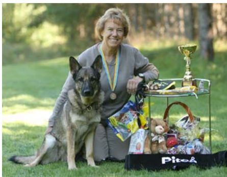
Inki&Kaksi SM 3:a i Spår i Piteå