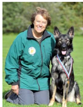
Inki&Yksi start på tävlingskarriären

Bokönvägen 13 372 92 Kallinge inki@sripublication.se www.sripublication.se Ideellt aktiv i Ronneby Brukshundklubb http://www.sbkronneby.com/